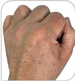
Handrücken vor der Behandlung