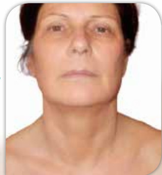
Hals nach der Behandlung