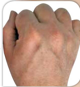
Handrücken nach der Behandlung