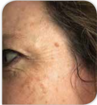
Gesicht vor der Behandlung