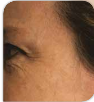
Gesicht nach der Behandlung